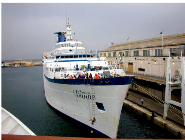
Le Princess Danae en escale à Marseille (avril 2005)